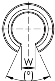
SM -OPN offen